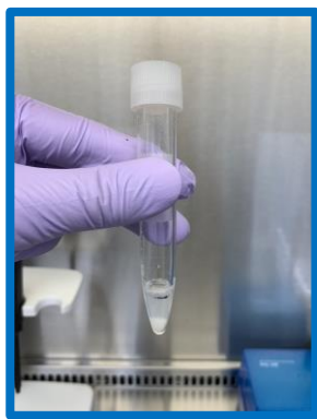
泡が少ない 十分量採取されている