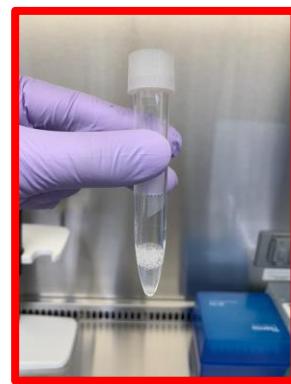
泡が多い 十分量採取されていない