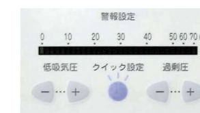
回路内圧警報設定

分時換気量上限：実測呼気分時換気量の 150% 分時換気量下限：実測呼気分時換気量の 70%